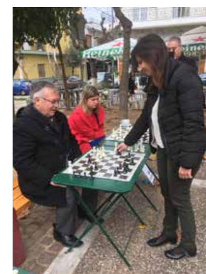
Με την Παγκόσμια πρωταθλήτρια και κάτοχο του Ρεκόρ Γκίνες στο σιμουλτανέ, Άννα Μαρία Μπότσαρη- Από τις Χριστουγεννιάτικες εκδηλώσεις της παράταξης στην πλατεία Τσιρακοπούλου