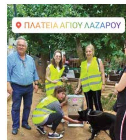
Από τη δράση για τα αδέσποτα της πόλης μας