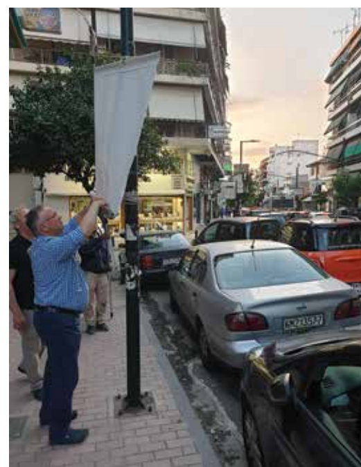
Από τη δράση «Καθαρίζουμε την Πόλη μας - Μαζεύουμε αφίσες της παράταξής μας»