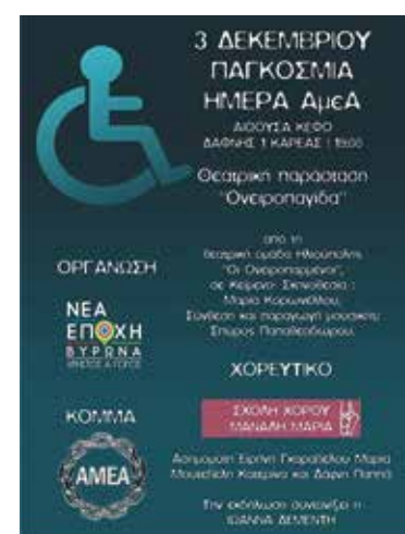
Από τη δράση για την Παγκόσμια Ημέρα ΑμεΑ