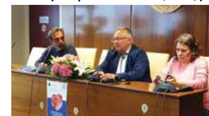
Εκδήλωση «Δότης Μυελού - Δότης Ζωής»