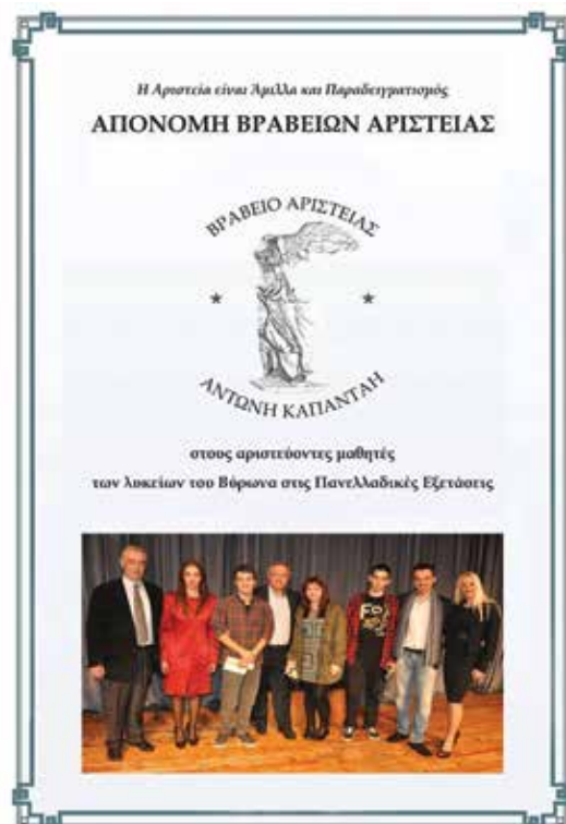
Βραβεία Αριστείας «Α. Καπάντας»