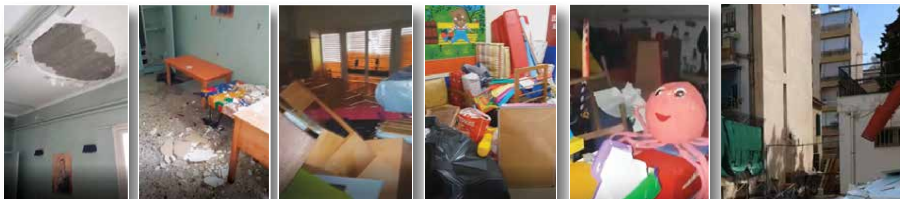
Φωτογραφίες από τις εργασίες στους παιδικούς σταθμούς

λόγο οι εργασίες έπρεπε να γίνουν άμεσα, μπορούσε κάλλιστα η δημοτική αρχή να καλέσει τους γονείς και τους ανακοινώσει, ότι πρέπει να γίνουν οι σχετικές εργασίες και ότι θα χρειαστεί να μεταφερθούν προσωρινά τα παιδιά σε άλλους παιδικούς σταθμούς. Μάλιστα, αυτό θα μπορούσε να γίνει οργανωμένα με στόχο γονείς, παιδιά και εργαζόμενοι να υποστούν τη μικρότερη δυνατή επιβάρυνση. Όμως η δημοτική αρχή δεν έκανε τίποτα από αυτά με αποτέλεσμα να εκθέσει σε κίνδυνο παιδιά και εργαζόμενους.