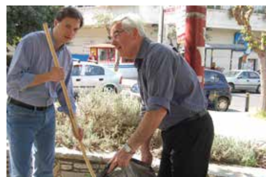
Φωτογραφίες από διάφορες δράσεις και παρεμβάσεις της παράταξης «Δημοτική Κίνηση Πολιτών Βύρωνα: Δύναμη Ελπίδας»