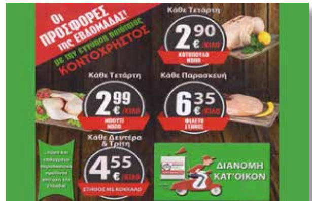
ΚΟΝΤΟΧΡΗΣΤΟΣ: Κοτόπουλα Ναυπάκτου. Δείτε περισσότερα...