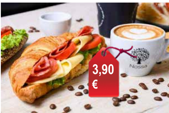
Eagle Specialty Coffee: Ένα σάντουιτς της επιλογής σας και ένα χυμό πορτοκάλι ή καφέ ΜΟΝΟ με 3.90 €