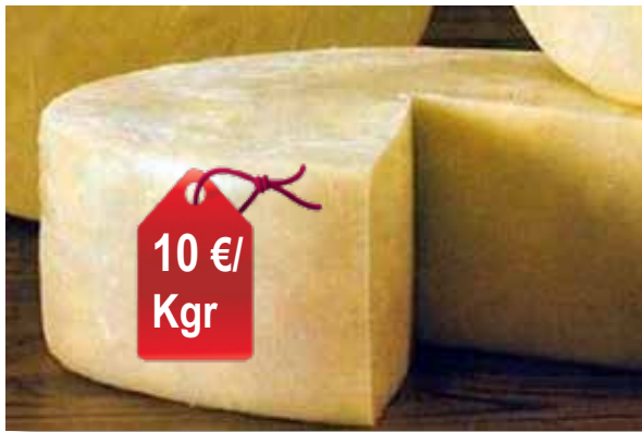
ΤΟ ΔΙΚΤΑΜΟ: Γραβιέρα Κρήτης πικάντικη, συνεταιρισμού Ρεθύμνου