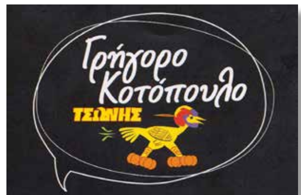
ΓΡΗΓΟΡΟ ΚΟΤΟΠΟΥΛΟ ΤΣΩΝΗΣ: Μισό κοτόπουλο με πατάτες με 5 €