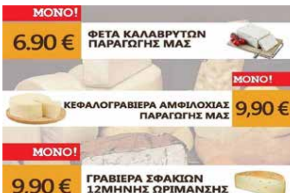
ΤΣΕΛΙΓΚΑΣ Τυριά - Αλλαντικά