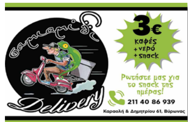
ΣΑΜΙΑΜΙΔΙ cocktail bar