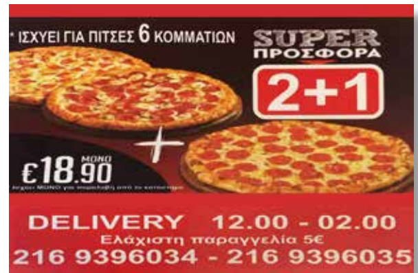
TOP CHEF Pizza