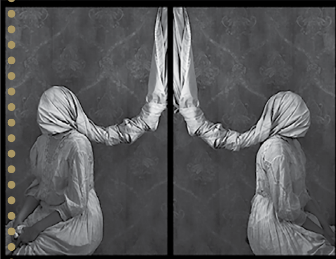
Sisters in silence