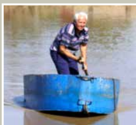
Ποιος θα μας σώσει απ' τους σωτήρες; του Δημήτρη Βασιλείου