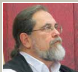
Ελεύθεροι να ξεφορτω- θούμε την ελευθερία μας του Θαν. Ι. Παπαθανασίου