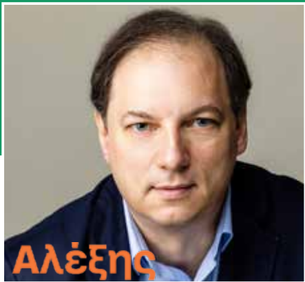
Αλέξης ΣΩΤΗΡΟΠΟΥΛΟΣ ΥΠΟΥΡΧΟΣ ΔΗΜΑΡΧΟΣ ΒΥΡΩΝΑ