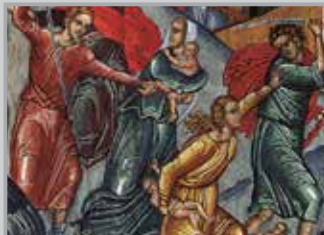
Δίχως το "Αχ!"... του Θανάση Ν. Παπαθανασίου