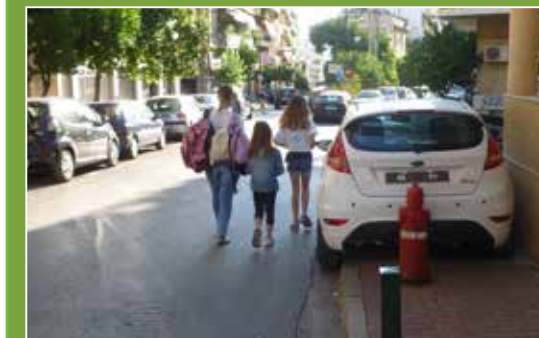
οδός Π. Τσαλδάρη