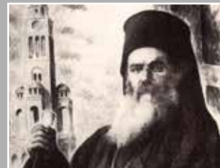
Οι τελευταίες ώρες του Χρυσοστ. Σμύρνης του Νίκου Χ. Βικέτου