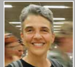
Πρόσβαση: ανάγκη ή πολυτέλεια; της Έλιας Ιατρού