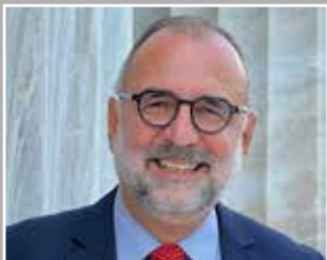
Βία και... ουτοπία του Αντώνη Ι. Αντωνόπουλου