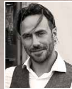
ΤΟΥ ΑΛΒΙΖΕ ΝΤΑΛ ΡΙ

Τι σκέφτομαι ε; Σκέφτομαι πως μου αρέσει η λογοκλοπή εκφράσεων, καμουφλαρισμένη ως φόρος τιμής και μέθοδος απόσπασης της προσοχής των αναγνωστών. Για να μην αναφερθώ στο μεταναφορικό κομμάτι της χρήσης μιας ατάκας που παραπέμπει σε συγκεκριμένο αντικείμενο, κάνοντας αυτούς που την αντιλαμβάνονται να μειδιούν χάριν στην αναπάντεχη εμφάνισή της, καθώς και στο γλυκόπικρο, νοσταλγικό συναισθήμα που εκμαιεύει.