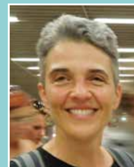
της Έλλιας Ιατρού

Γ ιατί κάποιος από εμάς οδηγούν χωρίς κράνος; Γιατί δεν φορούν ζώνη; Γιατί περνούν με κόκκινο; Πώς γίνεται να οδηγούν σαν να είναι άτρωτοι, παρόλο που κάθε μέρα ακούμε για τροχαία;