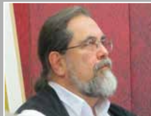
Μοναδικά, ήτοι πανανθρώπινα του Θαν. Ν. Παπαθανασίου