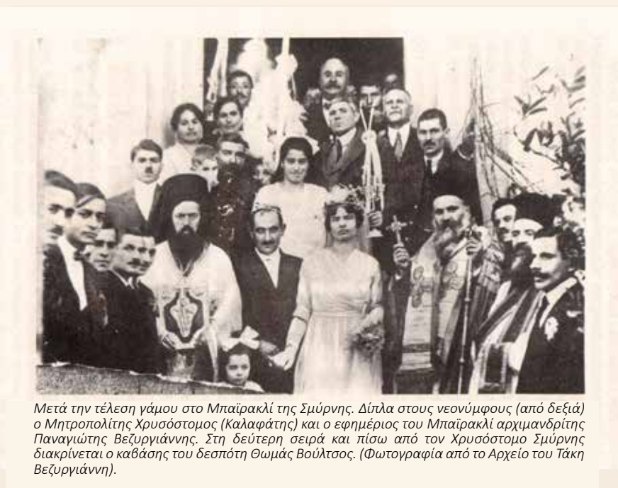
Μετά την τέλεση γάμου στο Μπαϊρακλί της Σμύρνης. Δίπλα στους νεονύμφους (από δεξιά) ο Μητροπολίτης Χρυσόστομος (Καλαφάτης) και ο εφημέριος του Μπαϊρακλί αρχιμανδρίτης Παναγιώτης Βεζυργιάννης. Στη δεύτερη σειρά και πίσω από τον Χρυσόστομο Σμύρνης διακρίνεται ο καβάσης του δεσπότη Θωμάς Βούλτσος.

Με αφορμή τις επετειακές εκδηλώσεις που πραγματοποιήθηκαν στο Βύρωνα τον περασμένο Σεπτέμβριο, για τη συμπλήρωση 100 χρόνων από τη Μικρασιατική Καταστροφή και το μαρτυρικό θάνατο του τελευταίου Ποιμενάρχη της Εκκλησίας των Σμυρναίων Χρυσόστομου Καλαφάτη του από Δράμας, κρίνεται σκόπιμο να μεταφέρουμε στο φιλόξενο χώρο της εφημερίδας αυτής κάποιες έγκυρες μαρτυρίες για το μαρτύριο του «περίβλεπτου» Ιεράρχη, όπως τις διέσωσε ο Δραμινός την καταγωγή πιστός καβάσης του Θωμάς Αρ. Βούλτσος.