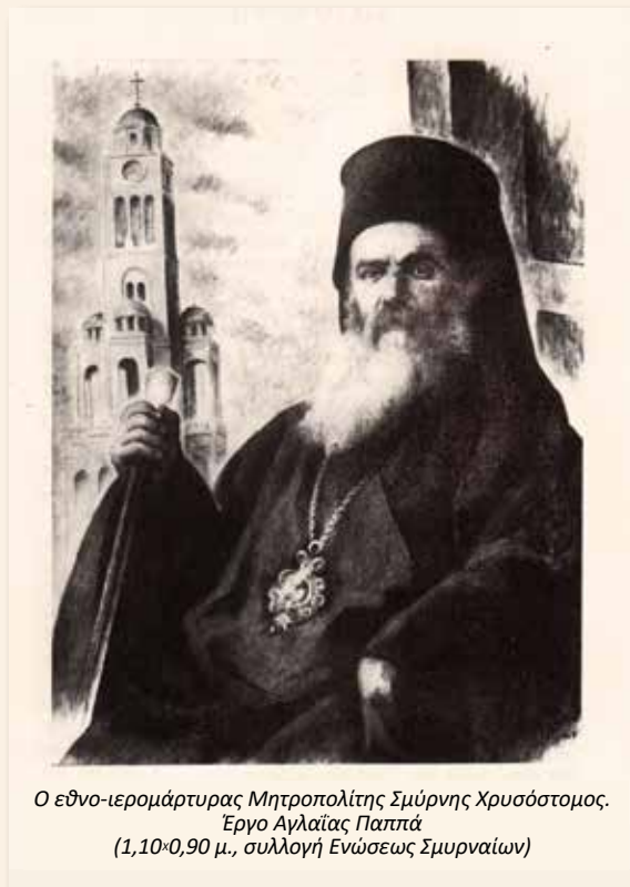
Ο εθνο-ιερομάρτυρας Μητροπολίτης Σμύρνης Χρυσόστομος. Έργο Αγγλαίας Παππά (1,10×0,90 μ., συλλογή Ενώσεως Σμυρναίων)